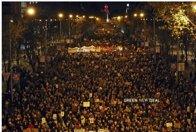
Foto - 100.000 mensen op straat tijdens de klimaattop in Madrid.

Analyse gemaakt door de Klimaatcoalitie en met hun goedkeuring overgenomen.