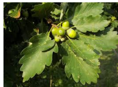
Foto - De wintereik met gesteeld blad

Schrik niet, zomereiken zijn veruit in de meerderheid. Wintereiken zijn, in mijn streek althans, een piepkleine minderheid. Bovendien was 2018 een mastjaar voor wintereiken. Dat betekent dat ze veel vrucht droegen. In 2019 waren er daardoor amper wintereikels. De kans dat ze in september-oktober '20 veel eikels voortbrengen, neemt daardoor toe.