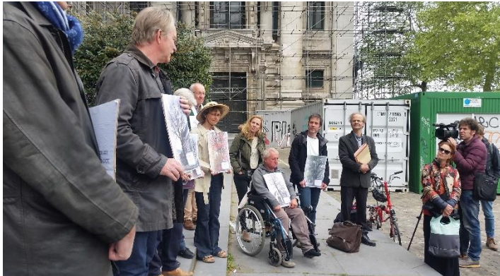
Foto - Bomenactie: indiening van het verzoekschrift op 3 mei 2019

Even ter herinnering. In naam van een aantal beschermde bomen op publiek domein dienden burgers (waaronder heel wat Aardewerkers) op vrijdag 3 mei 2019 een verzoekschrift in bij de rechtbank. Deze bomen vragen om toegelaten te worden als mede-eisers in de om tussen te komen in de procedure die werd ingesteld door de vzw Klimaatzaak.